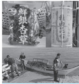
全国の皆様に、稚内の美味しい海産物を知って頂けるよう取り組んで参ります。

稚内の沿岸漁師として、春先からはナマコ・ウニ・タコ、7月からは昆布、冬場は銀杏草の漁と加工を行っています。稚内自慢の海の幸をご賞味下さい。