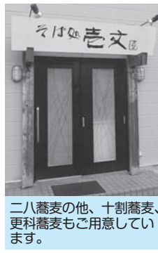
二八蕎麦の他、十割蕎麦、更科蕎麦もご用意しています。

道内産蕎麦粉を使用した手打ちそばのお店です。つゆは利尻昆布と枕崎産鰹で出汁を取り、飲み干したくなる味に仕上げられています。ご来店お待ちしております。