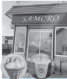
定休日は木曜日です。電話での予約注文、テイクアウトも承っております。

クレープ専門店として創業しました。イチゴ生クリームを始めとした8種のクレープ、コーヒーやトロピカルジュース、アルコールもご用意しております。