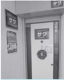
お昼は11時から15時まで、夜は20時からの営業です。月曜日の夜はお休みです。

年代を問わず、お一人様でもお気軽にご来店できるお店です。予約等もお受けしております。皆様のご来店を心よりお待ちしております。