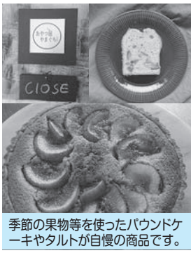
季節の果物等を使ったパウンドケーキやタルトが自慢の商品です。

「ちよつとクセがあるけどくせになるおやつ」をコンセプトにお菓子作りをしています。珈琲や季節に合わせたお飲み物も併せてお楽しみ頂けたら幸いです。